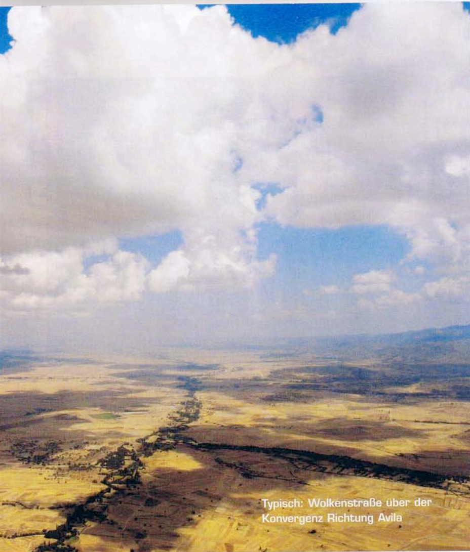
Typisch: Wolkenstraße über der Konvergenz Richtung Avila